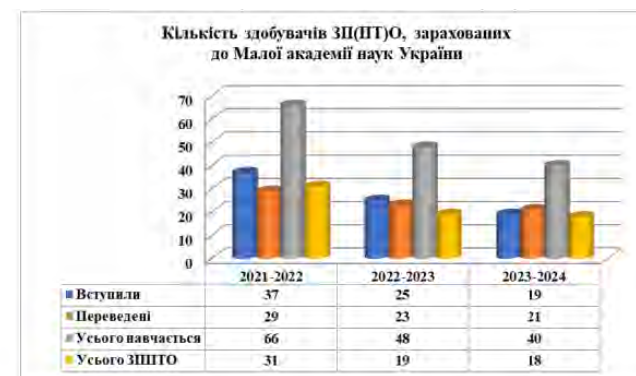
Діаграма 1. Кількість здобувачів ЗП(ПТ)О, зарахованих до Малої академії наук України.

Кількість зарахованих з закладів професійної (професійно-технічної) освіти у порівнянні з загальною кількістю зарахованих до МАН